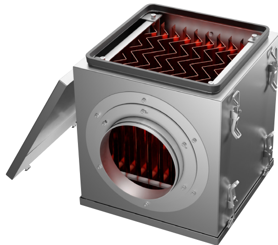
TEKA Funkenfalle 315 Art. Nr. 9501490315059006